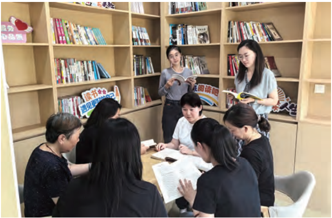
近日,台北(华茂)公司工会组织女职工在康乃馨服务站开展“读悟经典启新思,践行四再建新功”专题读书分享会,在书籍品读与思想交流中,凝聚践行“四再”精神的共识与动能。(宋文静)

加强氛围营造,突破“文体活动同质化”壁垒。以“迎新春”趣味运动会、“三八”节系列活动、迎“五一”文体活动等丰富职工业余生活。投资完成职工书屋墙体翻新、书架更新及书籍补充,全新打造“三组联建活动室”与文化长廊,开展“月读一本书”活动,滋养精神世界。通过完善文化阵地与创新特色活动,突破文化建设“形式单一”局限,促进职工身心健康。(张 飞)