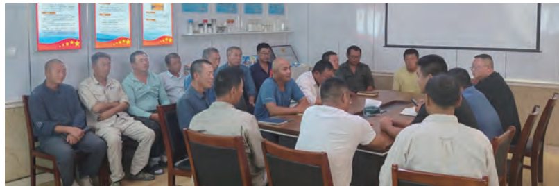
连日来,日晒制盐公司以形势任务教育座谈会为重要抓手,聚焦盐业生产堵点、痛点,通过分层研讨、靶向施策,重点围绕“控产与单耗平衡”“不扒盐与工艺适配”两大关键矛盾展开深入研讨。以问题为导向动态调整策略,全力破解生产难题,为盐业生产提质增效、实现高质量发展提供坚实基石。(程龙)

精准落实权益福利,传递企业关怀度。在健康保障上,工会每年组织全体适龄女职工开展宫颈癌、乳腺癌专项体检,同时建立健康档案,为筛查异常人员提供就医指导;在特殊关怀上,2025年起按每人每年500元标准,按季度为女职工发放卫生物品,缓解生活支出压力;在福利优化上,针对以往生日蛋糕福利“时间滞后、体验感差”的问题,改为生日当月“实时发放”,让福利更贴心。(段绪曼)